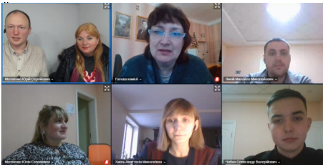
Фото 2. Голова ДЕК аналізує якість кваліфікаційних робіт та підготовки магістрів