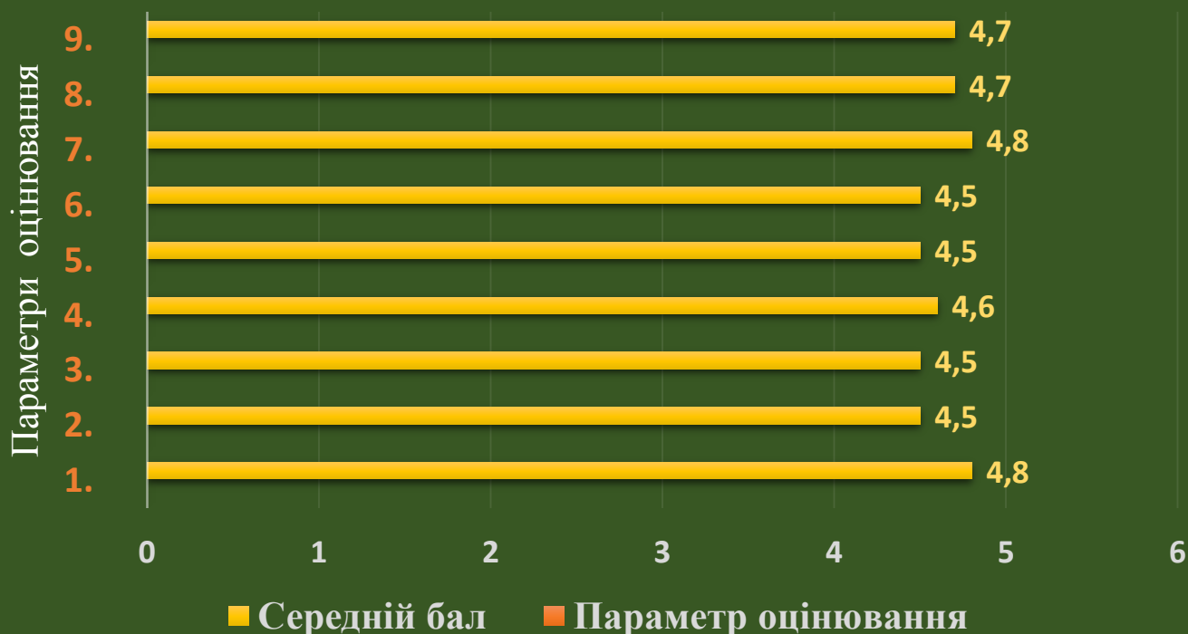
Рис. 1. Результати опитування студентів щодо організації та якості викладання навчальних дисциплін в 1-му семестрі 2019-20 н.р.